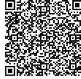
Centro de Negocios