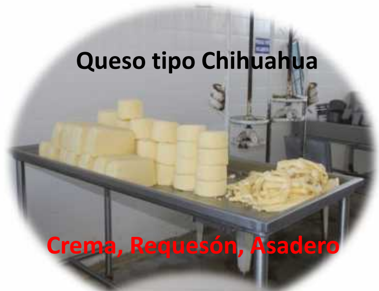
Queso tipo Chihuahua