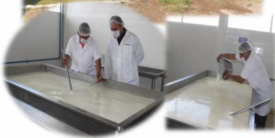
Crema, Requesón, Asadero