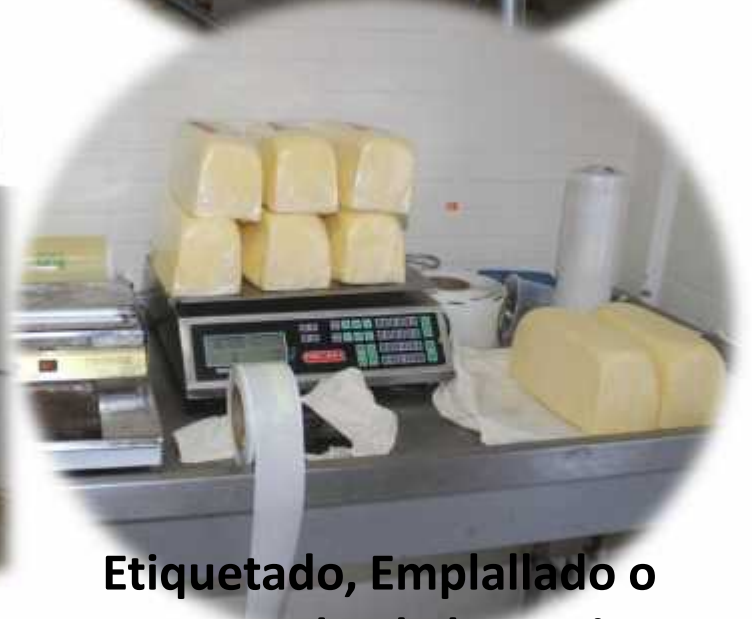
Etiquetado, Emplallado o empacado al alto vacío